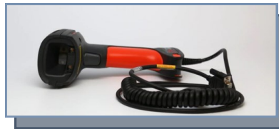
Lecteur code barre