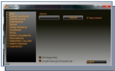
Transfert de liste de débit