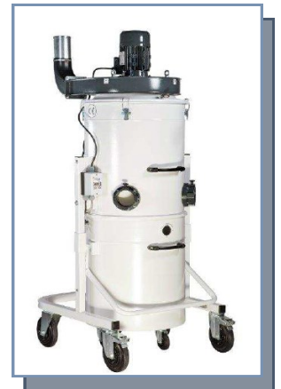
Aspirateur à copeaux